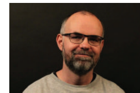
Boje Nielsen Rengøring